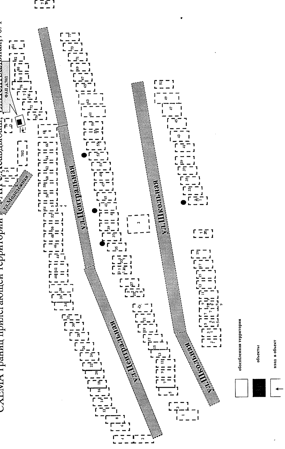
СХЕМА границ прилегающей территории к ФАП «Асавдыбаш», ул. Центральная, 70/1